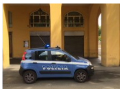
Modena: Dasp urbano per un 36enne spacciatore