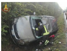
Scontro tra due auto in via Gherbella a Modena