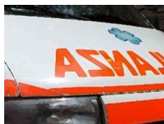
Casalgrande: 71enne muore otto giorni dopo incidente